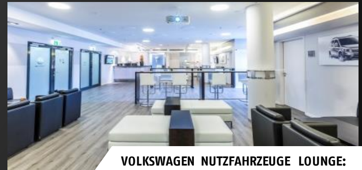
VOLKSWAGEN NUTZFAHRZEUGE LOUNGE: 300,- € pro Person