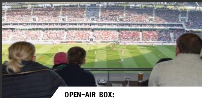
OPEN-AIR BOX: 225,- € pro Person